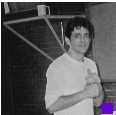
1er Noël dans le couloir de la mort 1995

« CE QUE VOUS VOYEZ ICI REPRÉSENTE CE QUE L'ÉTAT DU TEXAS M'A VOLÉ EN 27 ANS DANS LE COULOIR DE LA MORT POUR UN TRIPLE MEURTRE QUE JE N'AI PAS COMMIS. »